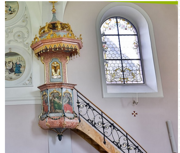
Kirche St. Joseph, Schlatt