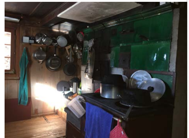
Toilette Obere Eugst, Gonten