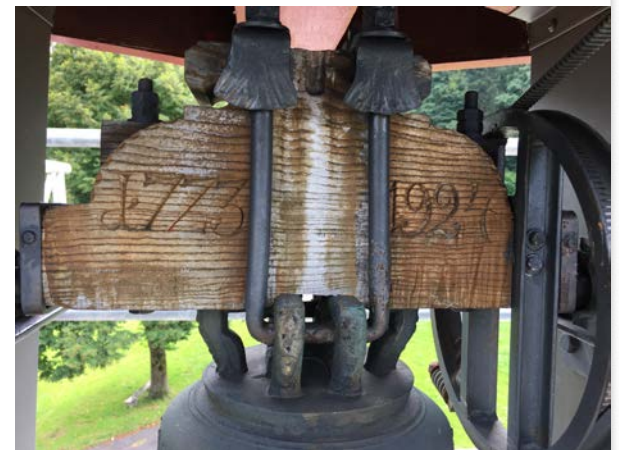
Glocke Kapelle Enggenhütten

Denkmale können Einzelobjekte, aber auch Teile oder Mehrheiten von Objekten sein, sowie städtebauliche oder kultur-landschaftliche Ensemble.