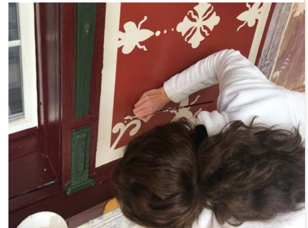
Renovation Bauernhaus Untere Lauften

Denkmalpflege ist ein Wirtschafts- und Beschäftigungsfaktor