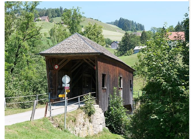
Zithuus Vorderhaslen (Foto Jeanette Geissmann, Architektur)

Denkmale können Einzelobjekte, aber auch Teile oder Mehrheiten von Objekten sein, sowie städtebauliche oder kultur-landschaftliche Ensemble.