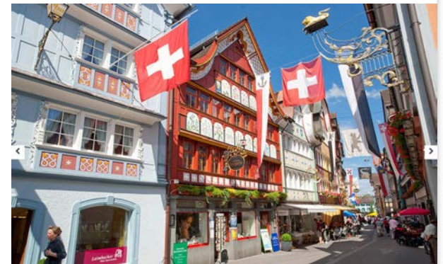
Schlatt, Ortsbild von nationaler Bedeutung

Denkmale können Einzelobjekte, aber auch Teile oder Mehrheiten von Objekten sein, sowie ortsbauliche oder kultur-landschaftliche Ensemble.