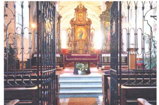
Klosterkirche Wonenstein um 1900